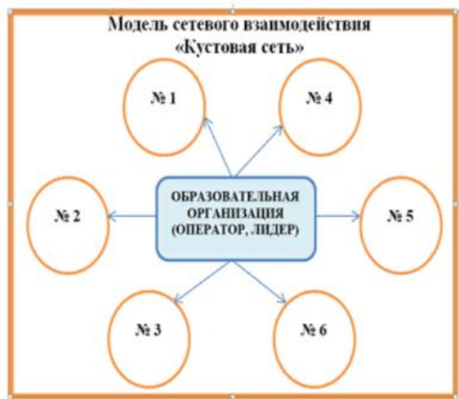
Рис.6. Кустовая модель сетевого взаимодействия

Смешанная модель , в которой участниками сети являются разные по содержанию деятельности, а иногда и по ведомственной принадлежности, и по организационной форме образовательные и «не образовательные» организации, у которых есть общие цели, интересы и идеи для реализации (Рис.7.).