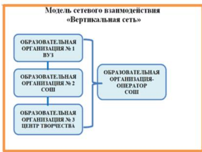
Рис.5. Вертикальная модель сетевого взаимодействия

2) формы «горизонтальной сети» (когда партнерами сетевого взаимодействия выступают несколько образовательных учреждений). Наиболее распространенный тип