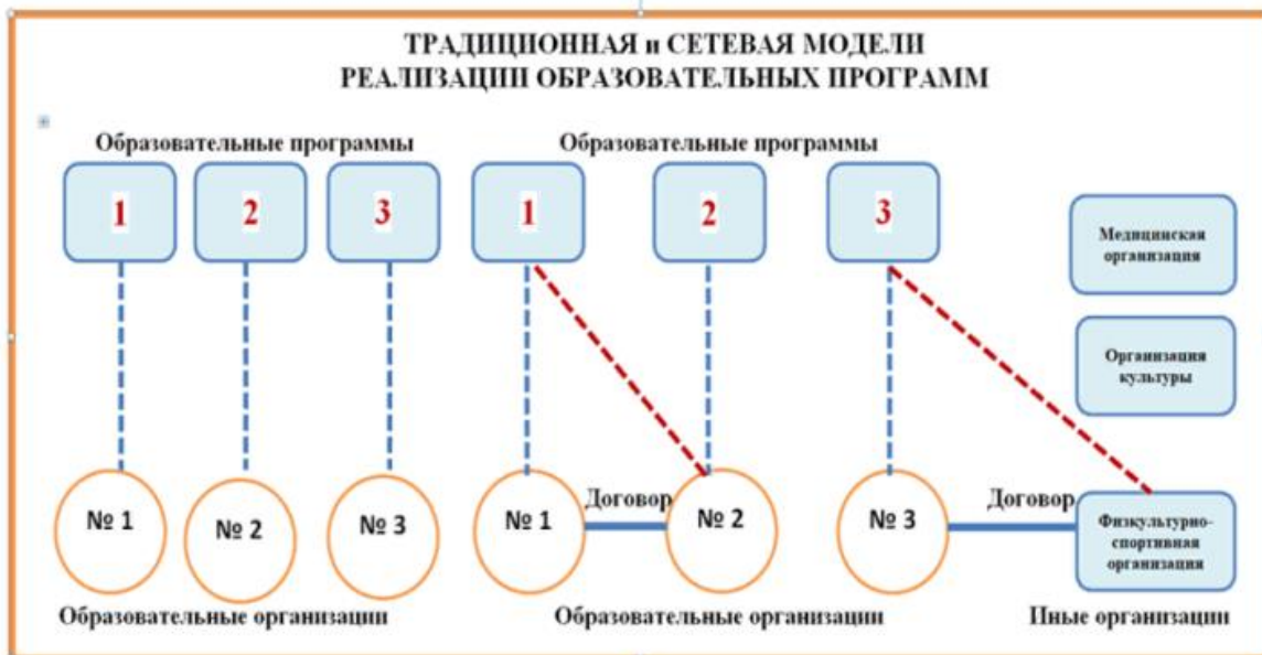
Рис.4. Традиционная и сетевая форма реализации программ

Условно все многообразие организационных форм сетевого взаимодействия общеобразовательных организаций, организаций дополнительного образования, профессиональных образовательных организаций, промышленных предприятий и бизнес-структур можно объединить в следующие группы: