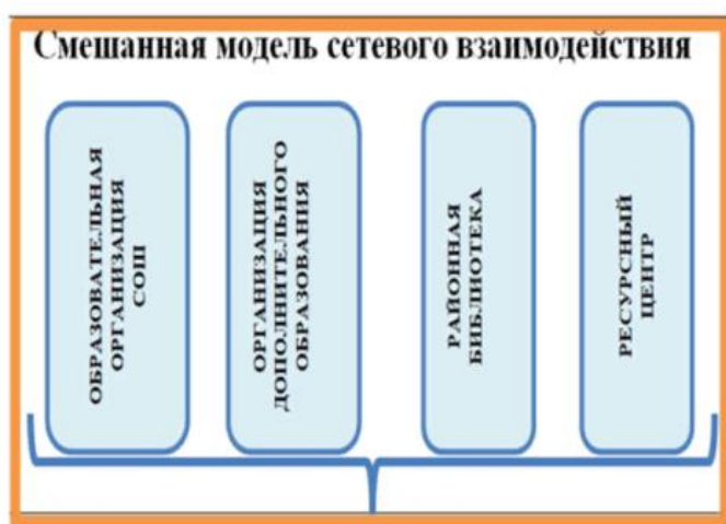
Рис.7. Смешанная модель сетевого взаимодействия