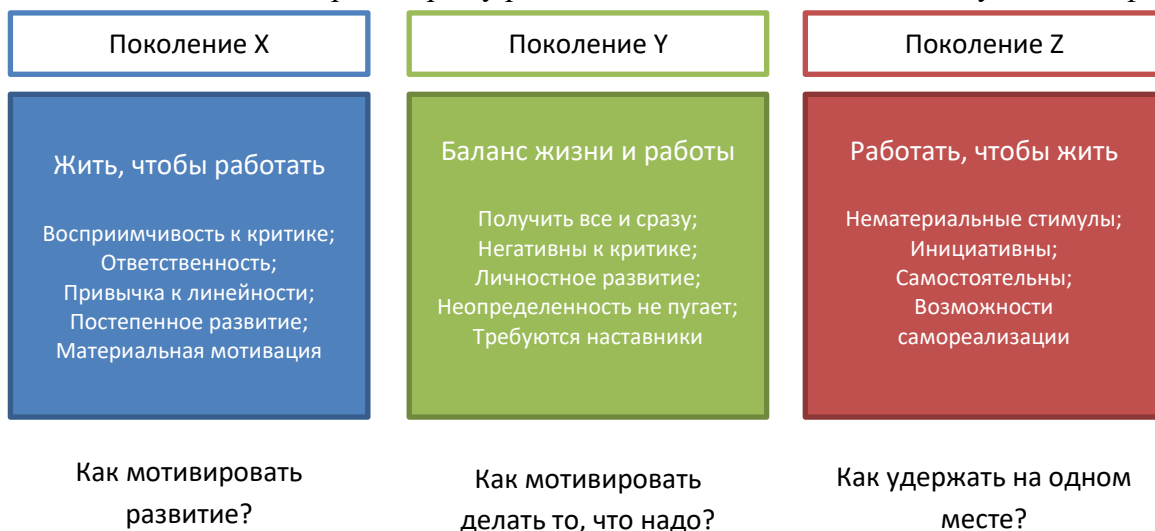
Рис.1. Смена ориентиров у различных поколений на глобальную персонификацию

В рамках анализа зарубежных технологий построения индивидуальных траекторий обучения учеными отмечается регулярное сочетание индивидуализации режима и содержания учебной работы с деятельностью учащихся в малых, переменных по составу группах, разработка и последовательное развитие специальных учебных материалов для осуществления индивидуализации обучения.