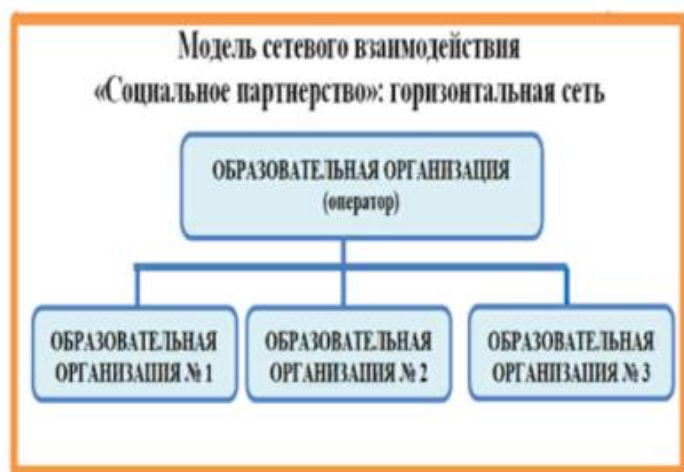
Рис.5. Горизонтальная модель сетевого взаимодействия

Кустовая модель предполагает наличие лидера, ядра. Модель, предполагающая группировку сети школ и организаций дополнительного образования детей вокруг одного более мощного образовательного учреждения – учебного ресурсного центра (Рис.7.)