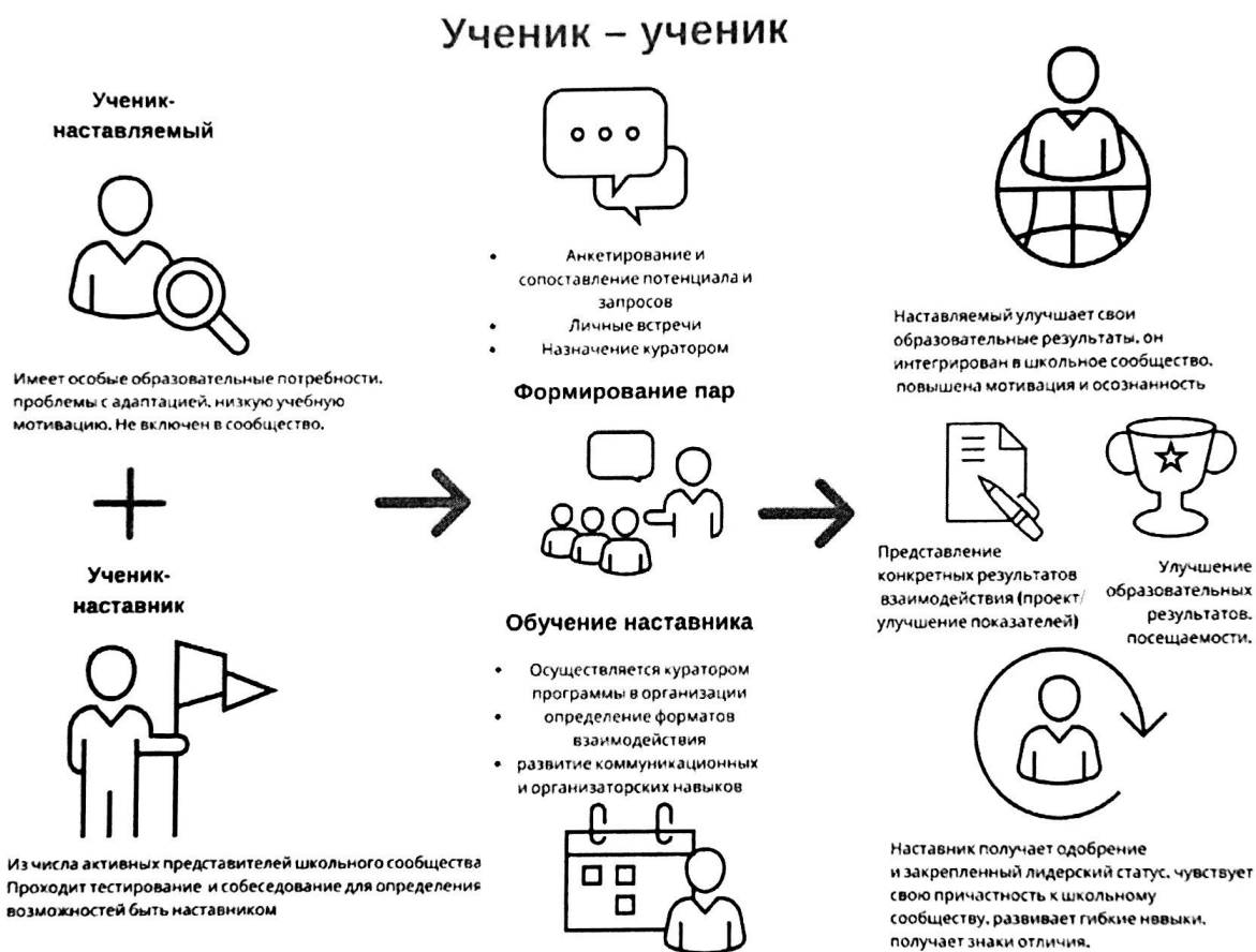
Рисунок 2. Графическое представление взаимодействия по форме «ученик – ученик»

Обучающийся с особыми образовательными потребностями – например, увлеченный определенным предметом ученик, нуждающийся в поддержке или ресурсах для обмена мнениями и реализации собственных проектов.